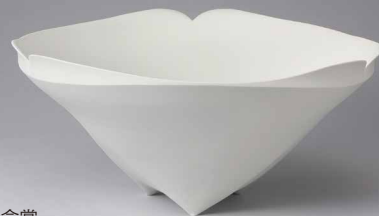
60回記念賞 白磁鉢 五嶋 竜也(陶芸)