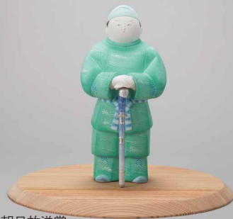
QAB琉球朝日放送賞 陶彫割貫彩色「海の防人」 中村 弘峰(人形)