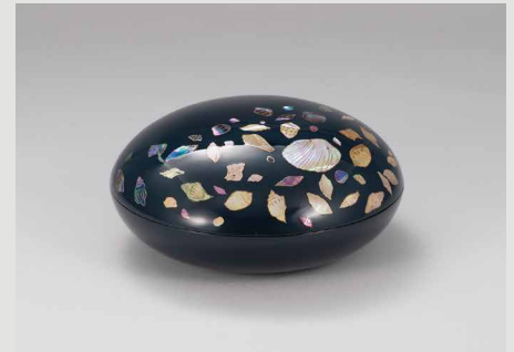
青漆チンポラー螺鈿蒔絵合子 松崎 森平(漆芸)