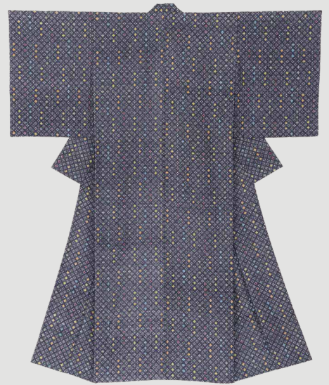
沖縄タイムス社賞 琉球紅型両面臚型着物「燦」 知念 冬馬(染織)