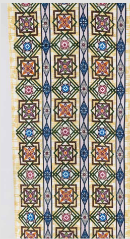
紅型着尺 「初夏の花々・おぼろ型」玉那覇 有勝(染織)