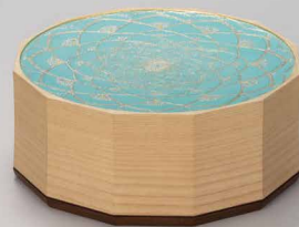
西日本新聞社賞 截金飾宮「翠鏡」 江里 朋子(諸工芸)