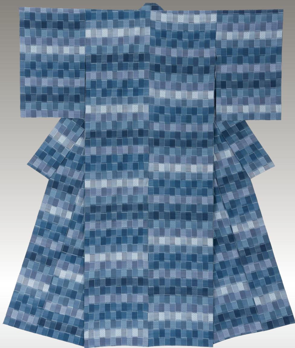
朝日新聞社大賞 花織絁着物「藍のコンポジション」 能勢 玲子(染織)