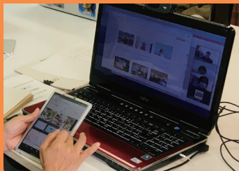
発信力を高める、実践的な演習