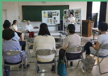
ブランド力を高めるワークショップ