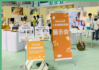
集客と展示会のノウハウを学ぶ